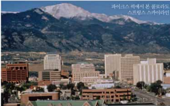
파이크스 픽에서 본 콜로라도 스프링스 스카이라인